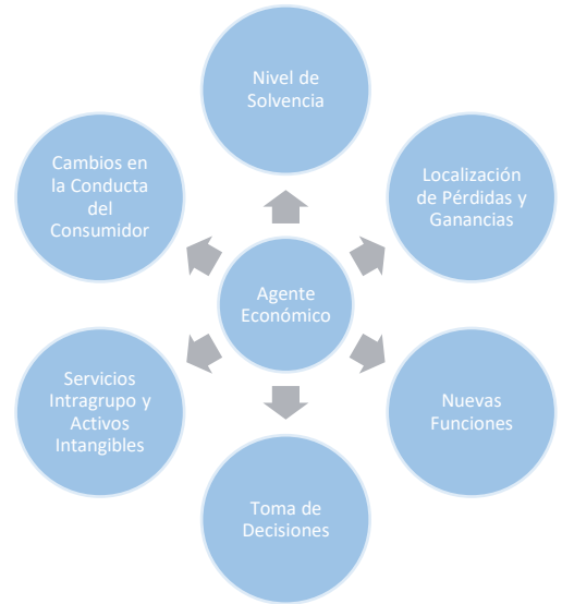
Ilustración 2: Problemas a los que se enfrentarán las empresas que efectúan operaciones con partes relacionadas.

En las condiciones actuales donde el nivel de operatividad de una gran parte de los sectores económicos se ha visto afectado, es importante sustentar adecuadamente la necesidad de incurrir en erogaciones relacionadas con servicios intragrupo o intangibles, identificar la incidencia de estos en la generación del