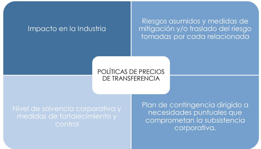
Ilustración 3: Aspectos relacionados con las políticas de precios de transferencias a ser revisadas por las empresas.

Esto implica la necesidad de valorar la flexibilidad de las políticas de precios de transferencias de los grupos empresariales, su adaptabilidad a la realidad singular de sus miembros, así como a las actuales circunstancias, por tanto, es importante revisar los modelos de contraprestaciones vigentes y sus respectivos compromisos a sobrellevar, como también, algunos componentes preestablecidos como: