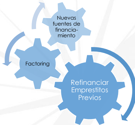
Ilustración 1: Posibles vías de recuperación de los niveles de solvencia de las empresas vinculadas.

En la actualidad, los agentes económicos se enfrentan a fuertes contrariedades que han puesto a prueba su capacidad de resiliencia. Uno de los obstáculos a salvar es el menoscabo de los niveles de solvencia (que seguramente) serán fortalecidos a través de: